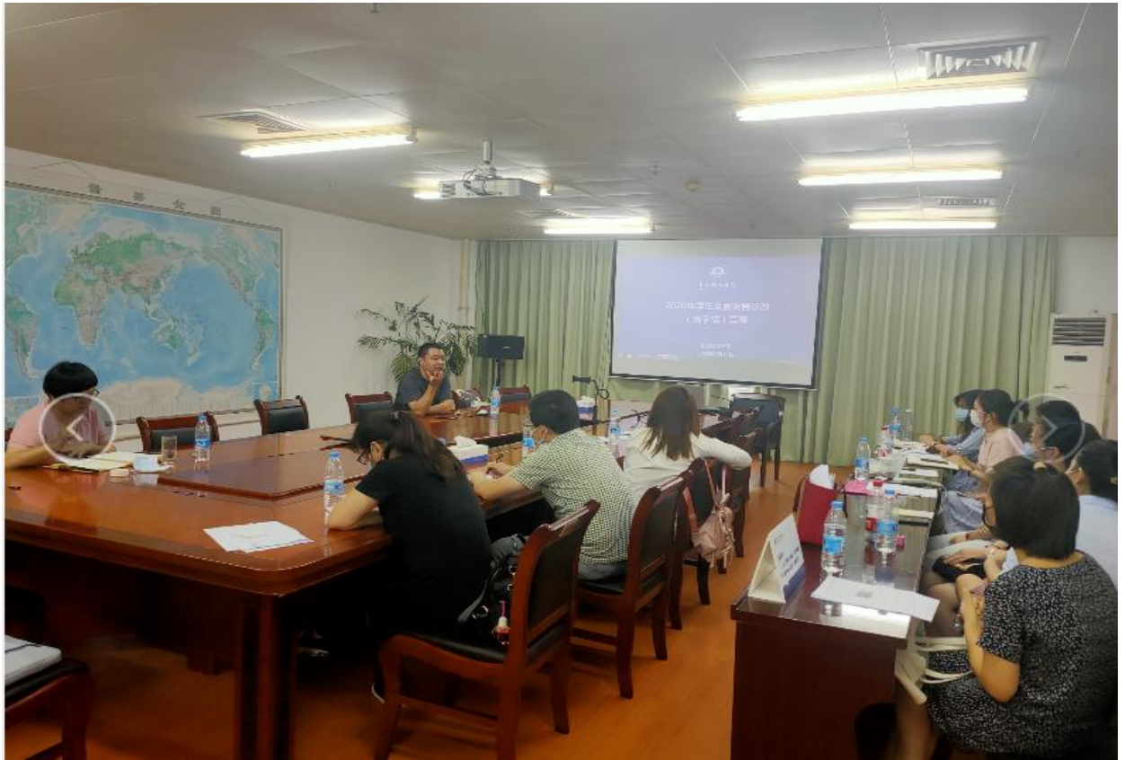
数据信息学院举行学生发展诊改（说学情）预赛