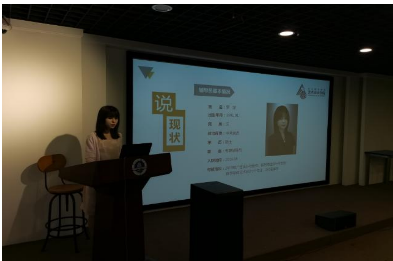
艺术设计学院举行学生发展诊改（说学情）预赛