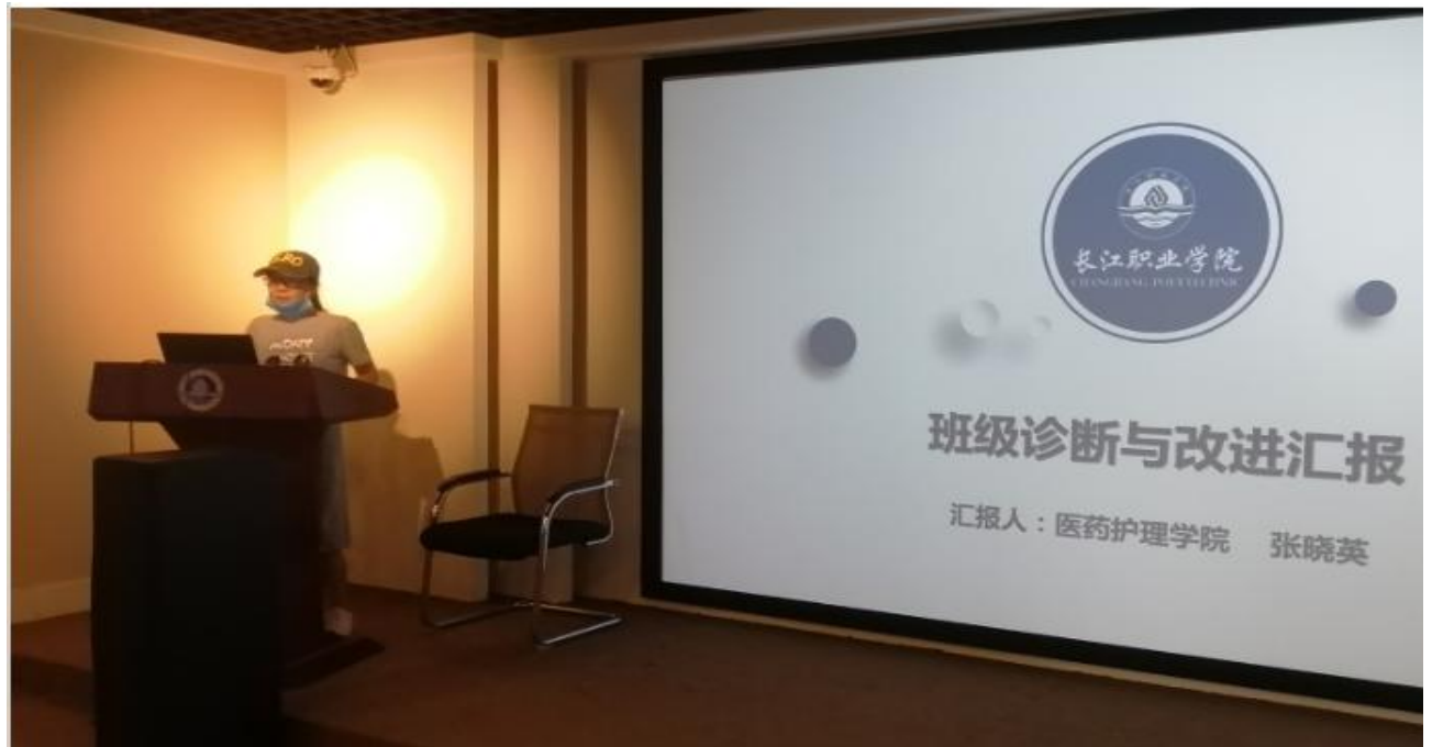
医药护理学院举行学生发展诊改（说学情）预赛