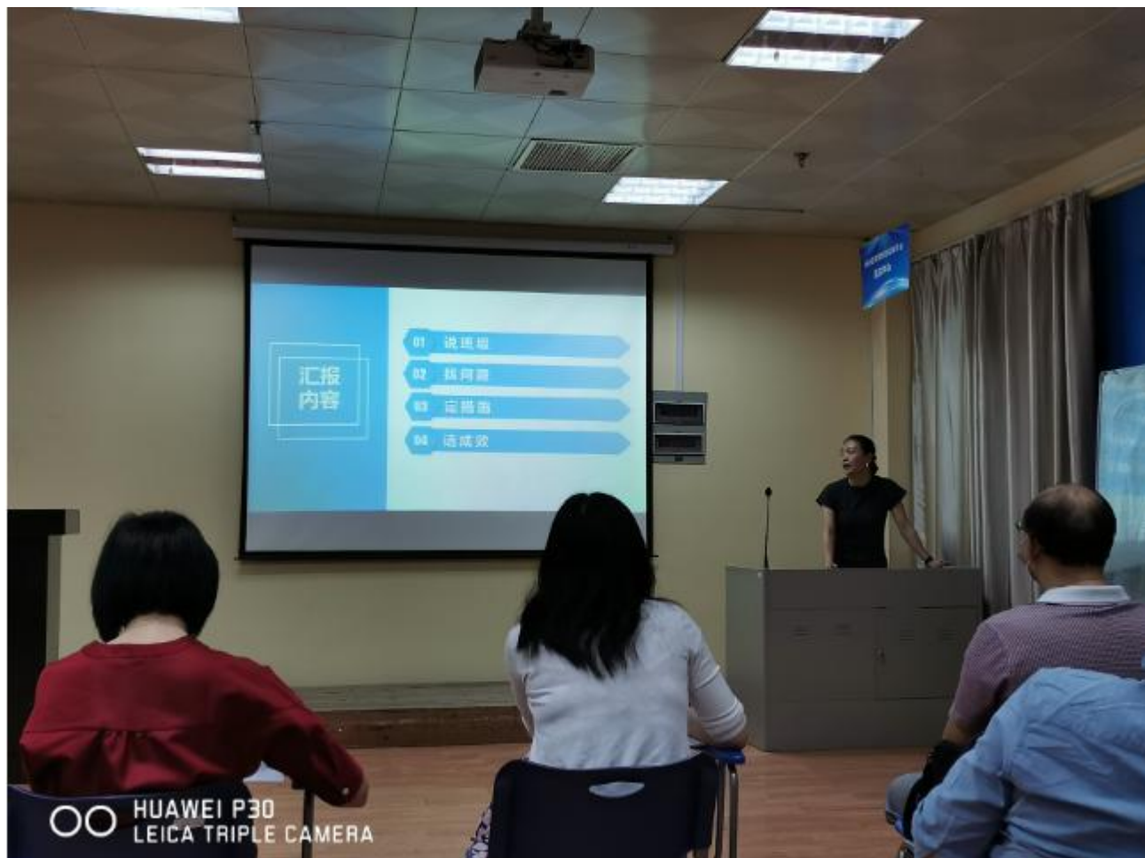
电商物流学院举行学生发展诊改（说学情）预赛

7月10日-20日，党委学生工作部、学生工作处组织开展学生发展全面诊改活动暨说学情比赛，通过学院初赛，共有16名老师进入决赛。