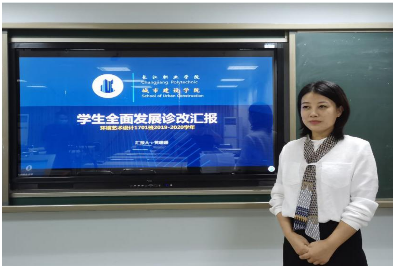
城市建设学院举行学生发展诊改（说学情）预赛