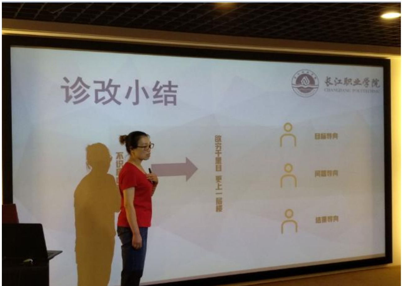
机电汽车学院举行学生发展诊改（说学情）预赛